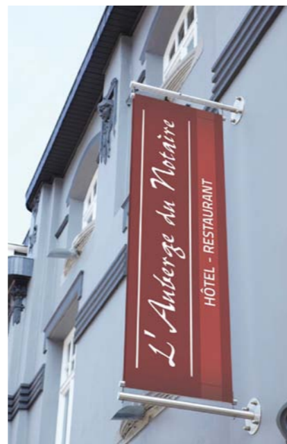
MODERN CHARMEHOTEL MIDDEN IN DE ARDENNES