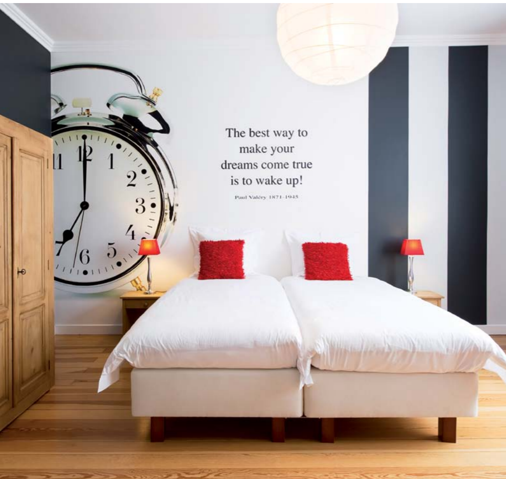
PURE KAMERS MET COMFORTABELE BEDDEN.