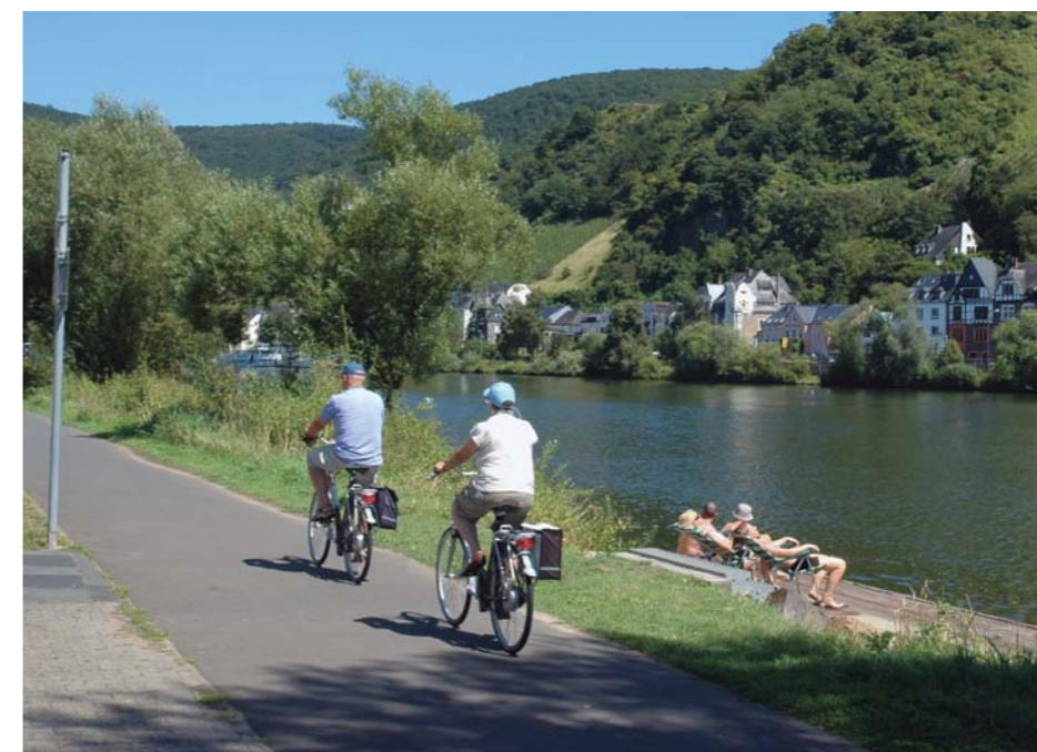
OOK VOOR MINDER GEOEFENDE FIETSEERS, ZIJN DE ARDENNES GESCHIKT

Na al die verwennerij is het tijd voor actie. We zijn tenslotte (ook) gekomen om te fietsen. Hoewel de dag wat heilig begon, breekt de hemel nu open en klimt de zon steeds hoger als we onze racefietsen uit de stalling halen. We vinden het fijn dat we onze fietsen, maar ook de schoenen, kleren en helm daar kwijt kunnen. We kruipen op de fiets, rijden de parking af en pikken dan bij de verkeerslichten de route van de Tour de France op. Vol goede moed suizen we naar beneden, richting Salmchâteau en van daar recht door naar Regné waar we klimmen naar de Baraque de Fraiture. Deze top meet 651 meter en is daarmee de derde hoogste top in de Belgische Ardennen. Dat je hier in de winter geweldig kunt skiën laten we nu maar even buiten beschouwing. Fietsen moeten we. En nog veel kilometers. Toch nemen we onderweg tijd om te genieten van het uitschietende malsgroene loof.