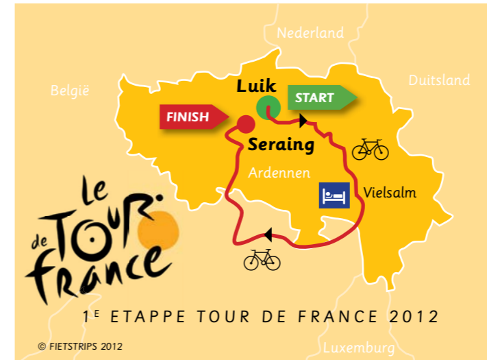
OP 1 JULI GAAT DE TOUR DE FRANCE 2012 VAN LUIK NAAR SERAING. DE ETAPPE IS 198 KM LANG EN NA 78 KM PASSEREN ZE VIELSALM