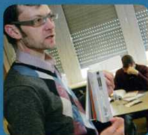
● Spelen met kleur is hard werken ...