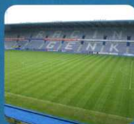
● KRC Genk: professioneel ploegspel