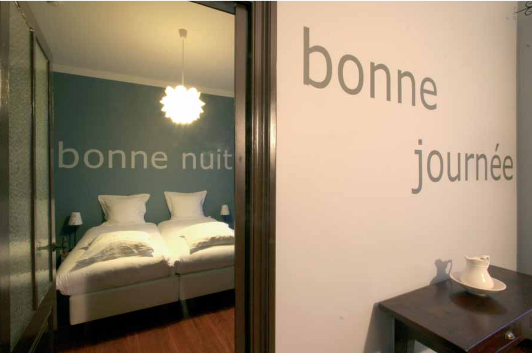
De kleine salon die diende als ontbijtkamer voor de notaris en zijn vrouw.