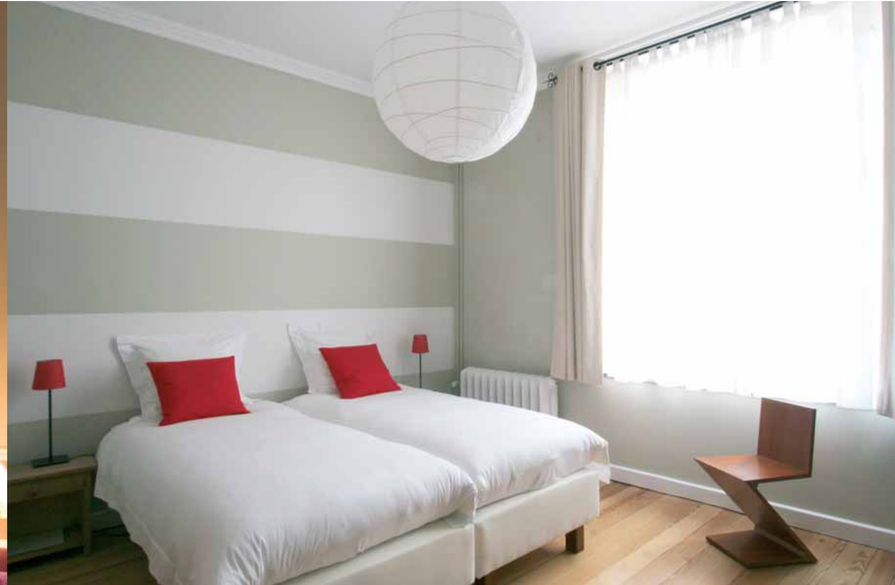
De voormalige slaapkamer van één van de dochter van de notaris.